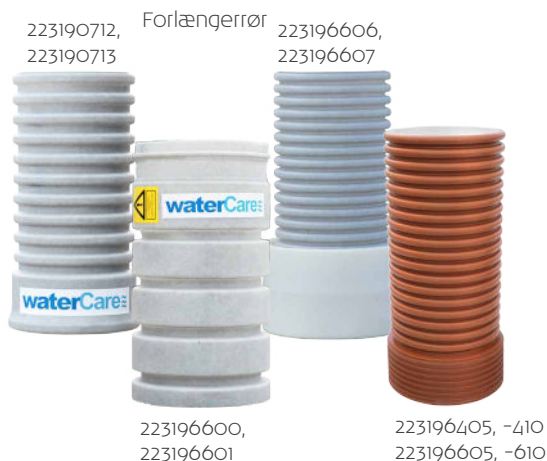
Forlængerrør 223196606, 223196607

Med et produkt fra WaterCare er man altid garanteret et dansk produkt af højeste kvalitet.