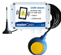
GSM VA-alarm: 223379835