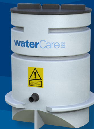
Skurvogsbrønd, VN: 223190607SK/609

Det er lovpligtigt med en alarm i pumpebrønden i tilfælde af pumpevigft. Se mere herom på side 10.