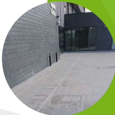
Brønddæksler Egedal Rådhus

Jesmig Brønddæksler og Riste produceres af smedejern og gennemgår herefter en korrosionsbehandling med galvanisering, hvorved de bliver rustfri. Nogle af dækslerne laves også i Corten stål. Dækslerne er godkendt af Teknologisk Institut i henhold til DS/EN 124. Produkterne er dansk designet og dansk produceret.