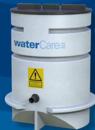
Skurvogsbrønd, VN: 223190607SK/609

Det er lovpligtigt med en alarm i pumpebrønden i tilfælde af pumpevigft. Se mere herom på side 10.