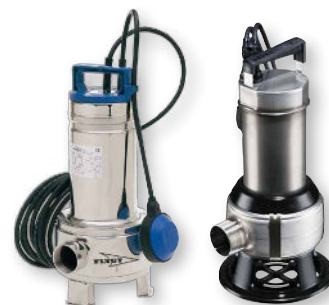
Flygt DXM35-5 og Grundfos AP35B

Ønskes større pumper, anden rørføring eller større brønde kan WaterCare være behjælpelig med dette.