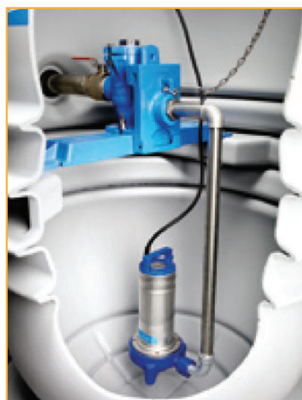
Dykket installation med hængende kobling til afgangsøret. Her i en Flygt Compit station.