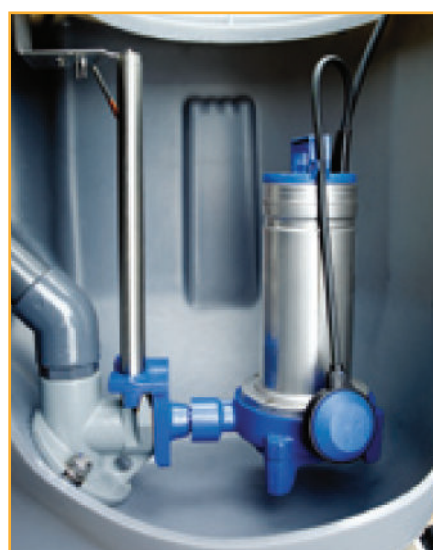
Dykket installation med koblingsfod og guiderør. Her i en Flygt Micro 7 station.